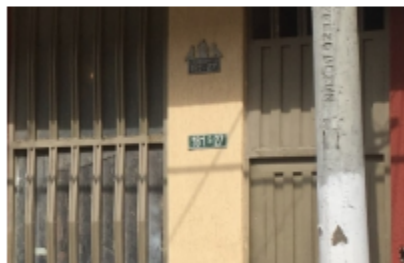
Fotografía No. 1 Placa del predio