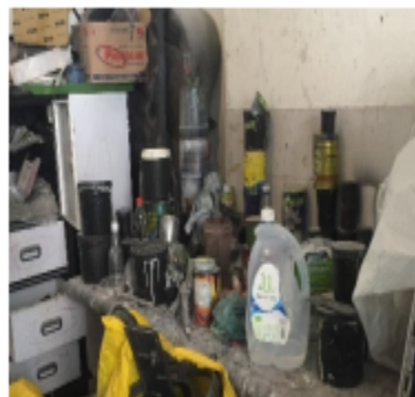
Fotografía No. 4 Insumos