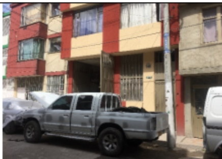
Fotografía No. 2 Fachada del predio