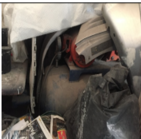
Fotografía No. 3 Compresor