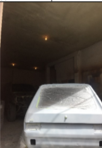
Fotografía No. 5 Interior del predio